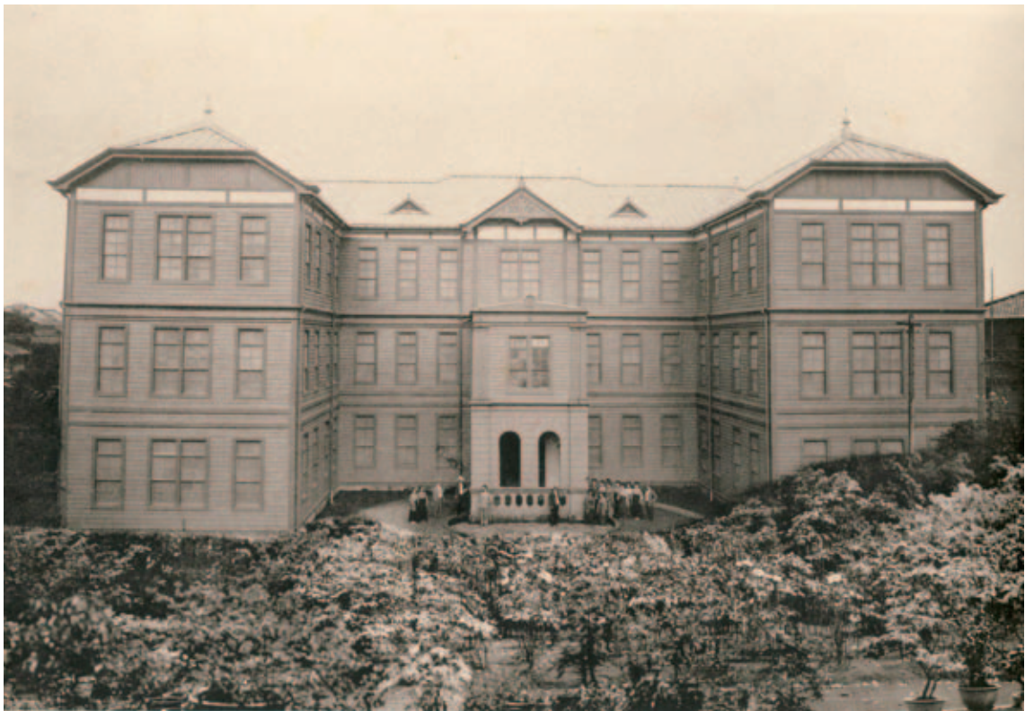
私立女子美術学校 菊坂校舎 明治42年（1909）7月