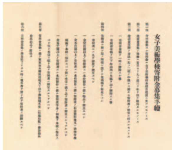
図2 私立女子美術学校寄付金募集手続 明治35年（1902）