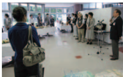
食堂にて情報交換会開催