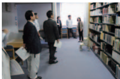
図書館・女子美アートミュージアム見学