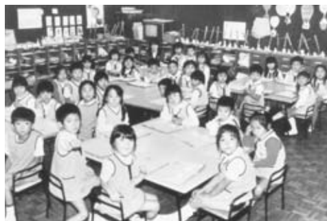
附属幼稚園の園児たち 昭和50年代