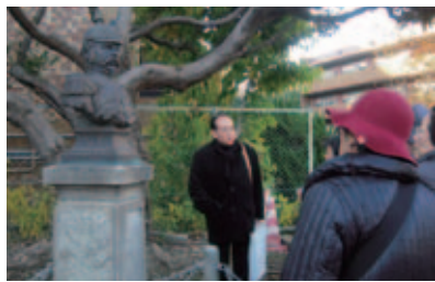
藤田文蔵《ミュレル像》前にて (東京大学本郷キャンパス内)