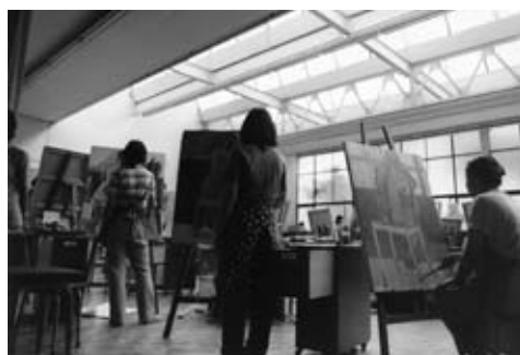
専攻科造形専攻絵画授業風景 昭和53 (1978) 年