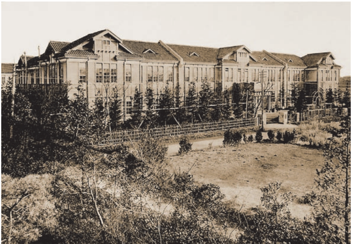
女子美術専門学校 杉並校舎 昭和10年（1935）