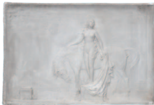
藤田文蔵《ゴディバ（犠牲）》（未完成）石膏レリーフ 1927年