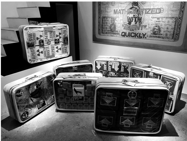
「レントゲン藝術研究所の研究」展示風景 手前作品：三上晴子《スーツケース》シリーズ 右上作品：津田佳紀《Personalized Man》 2019年6月

資料の解説だけでは、レントゲン藝術研究所で取り扱われた作品が具体的にどのようなものであったかを鑑賞者に伝えることが難しかったため、修士課程に進学後、2019年6月にラディウム - レントゲンヴェルケにて当時の作品を展示した。レントゲン藝術研究所に関する作品を直接鑑賞