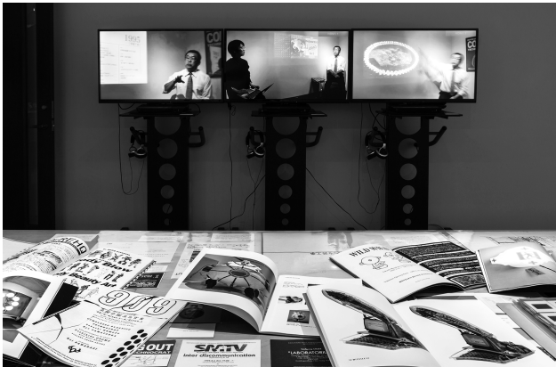
卒業制作展「レントゲン藝術研究所の研究」展示風景 2019年1月