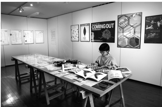
卒業制作展「レントゲン藝術研究所の研究」展示風景 2019年1月